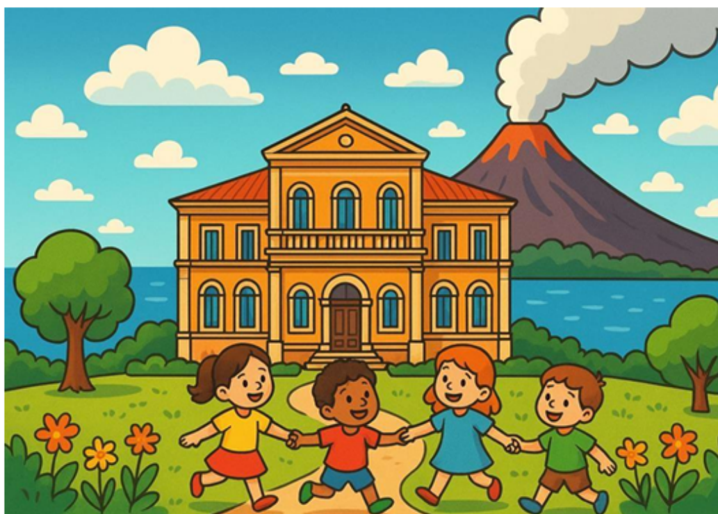
Immagine creata con l'Intelligenza Artificiale